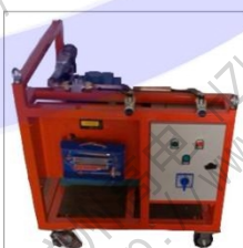
QDZ-45SF6 气体抽真空充气装置